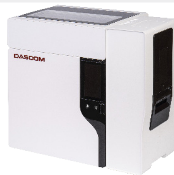
Modell mit 2. Schacht

DASCUM Europe GmbH Heuweg 3 | 89079 Ulm | GERMANY Tel.: +49 731 2075-0 | Fax: +49 731 2075-100 info@dascom.com | www.dascomeurope.de